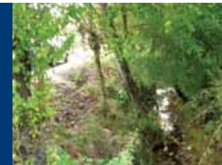
Крайпътен отводнителен канал

ОСНОВНАТА ЦЕЛ на конкретното проектно предложение е максимално преготвяване на рисковете за живота и здравето на населението и щетите върху инфраструктурата, сградния фонд, територията и околната среда, причинени от наводнения от повърхностни води в границите на с. Смирненски, община Брусарци.