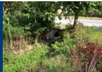
Отводнителният канал по ул. „Пирин“

ОБЩАТА ЦЕЛ на проектното предложение е в съответствие с целта на Операция 4.1 „Дребномащабни местни инвестиции“ на Оперативна програма „Регионално развитие“. Операцията цели както подобряване на възможностите за развитие, така и повишаване качеството на живот.