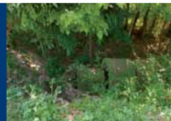
Отводнителните канали са изградени с различни материали