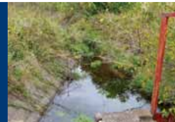
Канал М-1, преминаващ над с. Смирненски