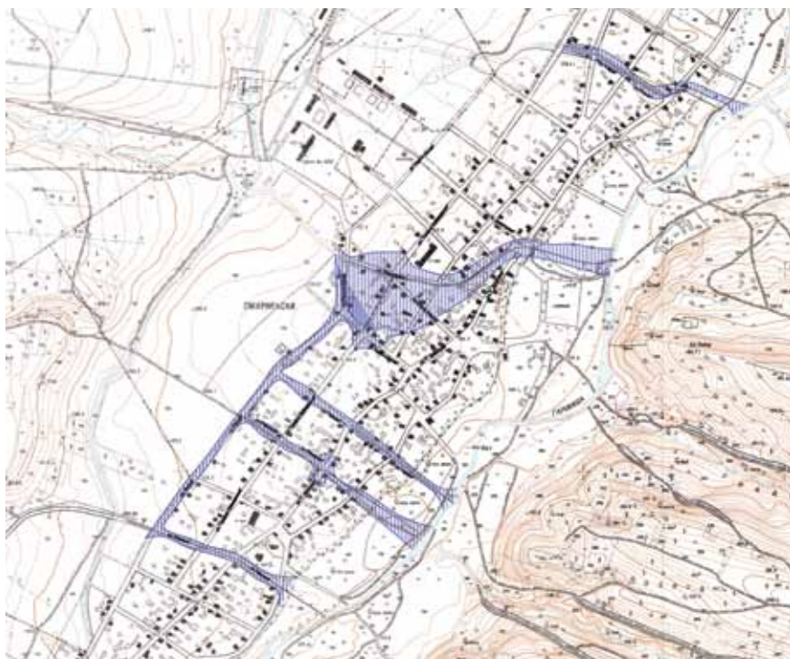
СИТУАЦИЯ „ЗАЛИВНИ ПЛОЩИ“