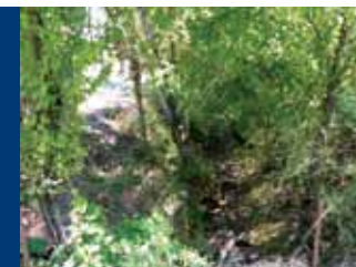
Крайлътен отводнителен канал

Работният проект за „Изграждане и укрепване на инфраструктура за предотвратяване на наводнения и заливане на територия в рамките на регулацията на с. Смирненски, Община Брусарци“ включва пет обекта на интервенция на територията на населеното място и почистване коритото на река Гаговица в участъците на заустване на отводнителните канали.