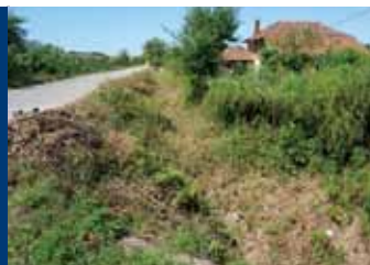
Долната част на дерето по ул. „Малина“